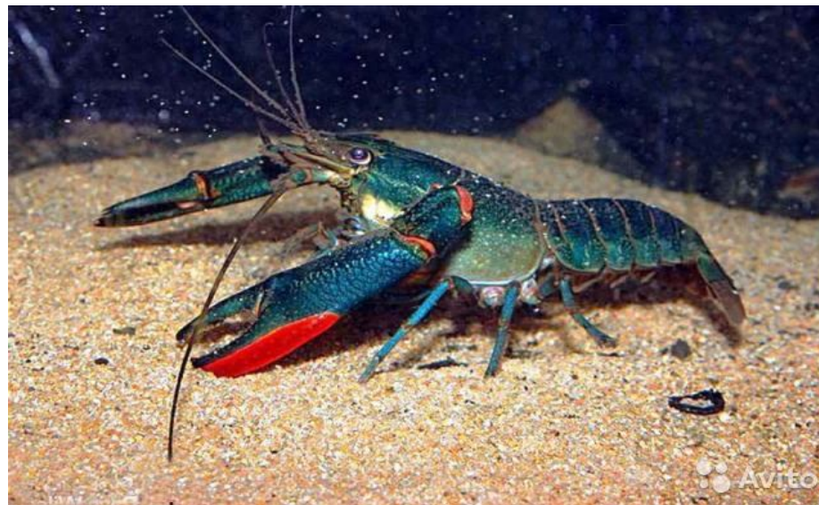
Рисунок 1. Австралийский красноклешневый рак

Отличительная черта рака - яркая окраска, типичная для тропических видов, которая колеблется от темно-коричневого до сине-зеленого (рис. 1). Взрослые самцы имеют заметные красные полосы на внешних краях клешней, давшие название животным. Раки способны достигать веса 600 г и длины 40 см. Самки меньше самцов. До наступления половой зрелости проходит от 6 до 12 мес. в оптимальных условиях выращивания. Самки производят от 300 до 800 икринок. Инкубационный период занимает около шести недель.