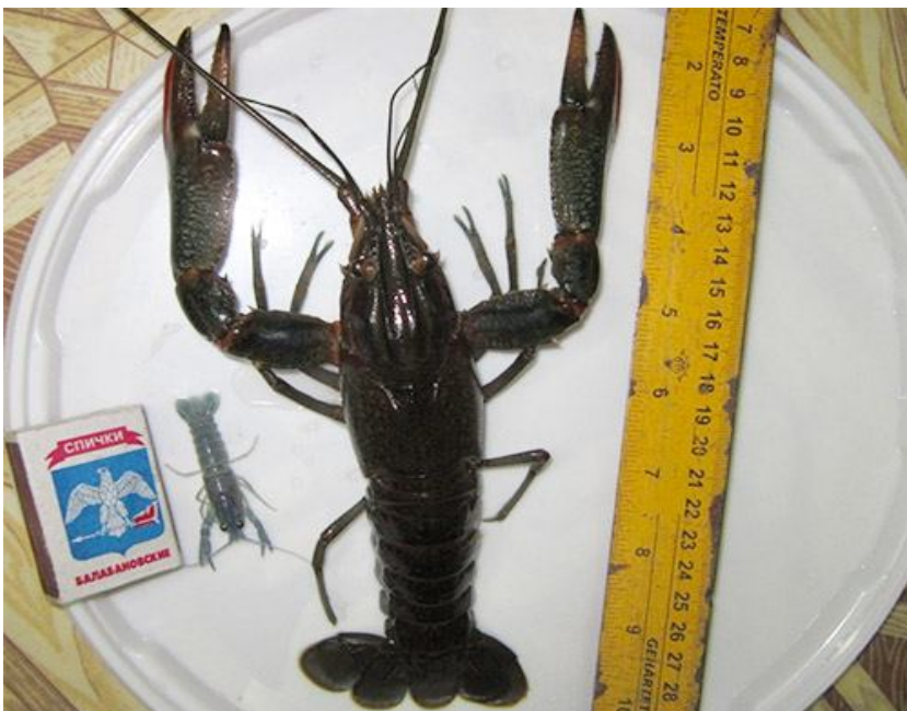
Рисунок 7. Разница в возрасте раков – три месяца