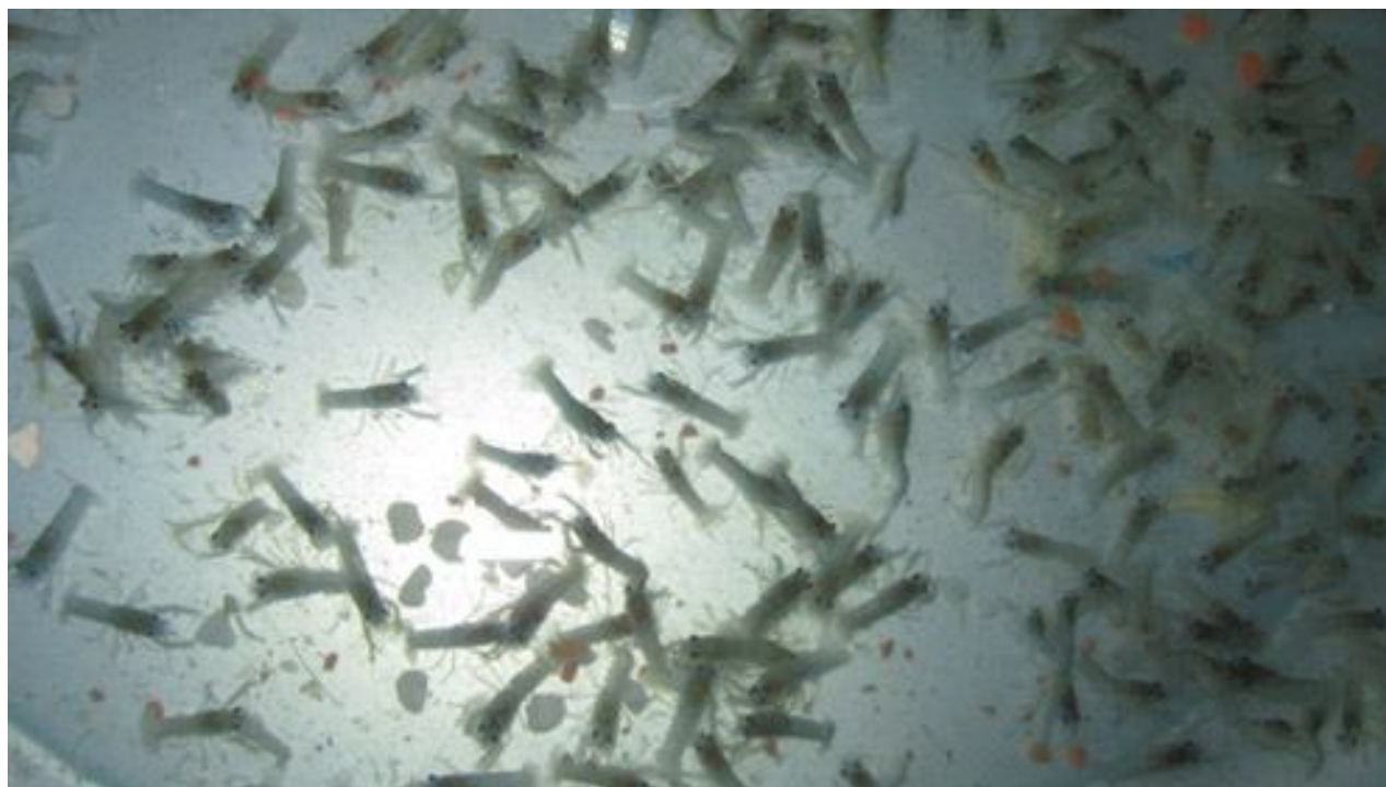
Рисунок 2. Молодь Cherax quadricarinatus в УЗВ

Что же касается России, то в связи с требованиями к среде обитания теплолюбивых Cherax quadricarinatus круглогодичная аквакультура данных животных в открытых водоемах невозможна, даже в субтропиках Черноморского побережья. Однако достижения российских и зарубежных технологий в области установок замкнутого водообеспечения (УЗВ) (рис. 2, 3) позволяют эффективно выращивать раков на территории многих регионов страны. Более низкая рентабельность производства по сравнению с методом аквакультуры в открытых водоемах нивелируется стойким спросом на продукцию и дополнительно свободой рынка в связи с санкционными ограничениями.