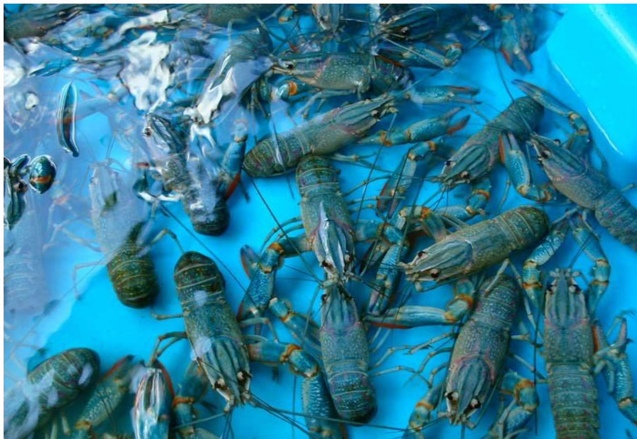
Рисунок 5. Производители Cherax quadricarinatus в УЗВ

При необходимости работы с производителями существует действенный прием, позволяющий сконцентрировать массу раков в определенной части бассейна. Речь идет о реотаксисе, или реакции особей на течение. А именно, при снижении уровня воды в бассейне особи активно передвигаются против течения. Эта особенность позволяет использовать для сбора производителей так называемые «поточные ловушки». Раки, перемещаясь против тока воды, собираются либо в заданной части бассейна, либо в специальном резервуаре (в зависимости от комплектации УЗВ).