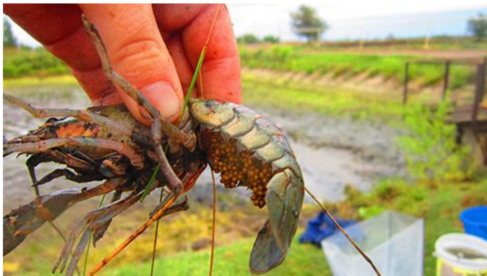
Рисунок 8. После облова: самка рака с икрой

Таким образом, полный производственный цикл получения товарного рака от личинки до взрослой особи навеской 50-70 г длится не более 12 месяцев: с сентября текущего по сентябрь следующего года.