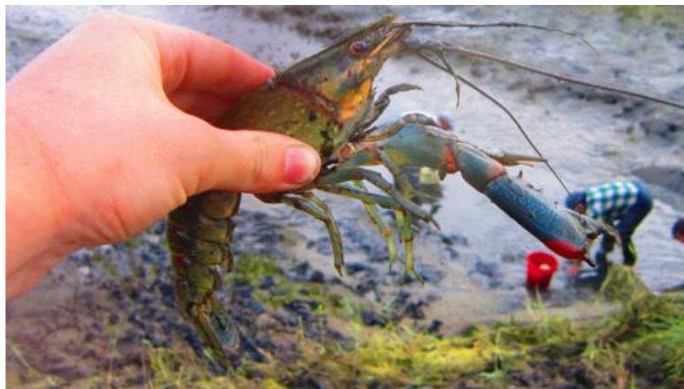
Рисунок 6. Облов пруда осенью

При наступлении благоприятного для аквакультуры рака температурного режима воды товарное выращивание его до навески не менее 50-70 г производится и полностью завершается в открытых спускных рыбоводных водоемах в течение 100-120 дней (в зависимости от региона). В период выращивания в открытом водоеме допускается колебание температуры воды от 18 (в утренние часы) до 32 °С. Выращивание осуществляется в интенсивном или экстенсивном режиме. Спуск воды и облов пруда рекомендуется осуществлять не позже периода, при котором суточная температура воды уже не превышает 19 °С (рис. 6).