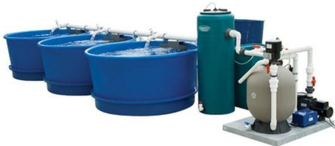
Рисунок 4. Компоненты установки УЗВ

Для кормления раков, как правило, используются наиболее изученные и поставленные на промышленную основу корма для креветок различных производителей. Такие корма представлены широким разнообразием рецептур.