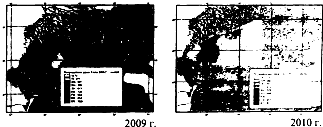
Рис. 1. Распределение раков в летний период, экз./км 2 .

Скопления раков в летний период 2009–2010 гг. распределялись на глубинах от 2.5 до 6.5 м и были приурочены к участкам с илистым песком и битой ракушей, которые наиболее предпочтительны для строительства нор. Макрофиты, которые встречались в районах скопления раков, использовались ими в качестве естественных укрытий. Содержание растворенного кислорода в придонных горизонтах колебалось в широких пределах, но в местах обитания раков зон гипоксии не наблюдалось.