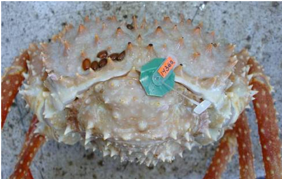
Рис. 2. Метка, закрепленная в мускульном тяже между абдоменом и карапаксом равношипого краба. Fig. 2. A tag attached to the muscular band between abdomen and carapace of the golden king crab.

Около 45% помеченных крабов составляли особи с неокрепшим панцирем на 2-й стадии линичного цикла. Мечение таких особей позволяло оценить продолжительность межлиночного периода. Стадии линичного цикла определяли согласно стандартной методике. Третью, наиболее протяженную стадию линичного цикла (твердый панцирь) подразделяли на раннюю, среднюю и позднюю подстадии (Михайлов и др., 2003; Карасев, 2004). Основным параметром, используемым для различения подстадий равношипого краба, являлся внешний вид клешни и исчерченность когтей перепопод.