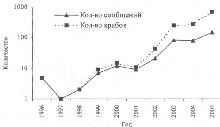
Рис. 1. Динамика количества сообщений и приловов краба-стригуна в Баренцевом море в 1996-2005 гг.