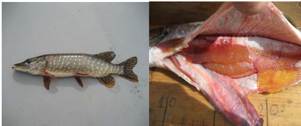
Рисунок 2. Исследование гонад самки щуки в апреле 2011 г.

К концу II декады апреля на IV стадии находилось 1,6%, на IV-V – 3,1% (рис. 2) и на VI – 92,2% рыб, т.е. большинство производителей отнерестилось.