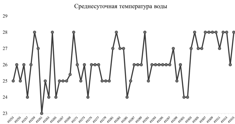
Рис. 2. Температурный режим в бассейнах тепличной аквапонной установки

Температура воды за весь период проведения экспериментов колебалась в нормативных пределах, что обеспечило хороший прирост клариевого сома. Для культуры клубники данная температура также считается нормативной [3, 4]. Динамика биогенных элементов представлена на рис. 3.