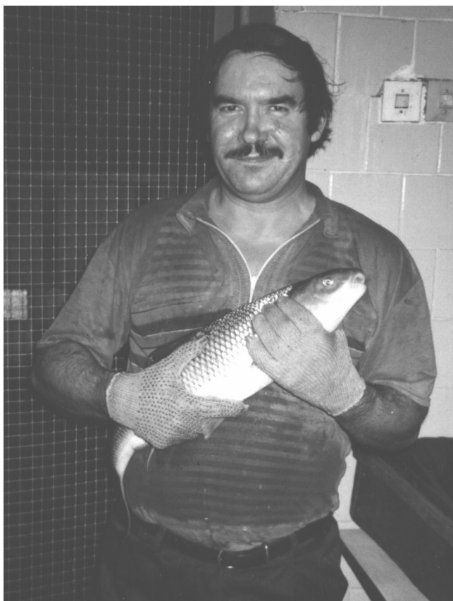
Рис.1. Этот экземпляр вырезуба (самец) был выловлен в Верхнем Дону и в течение нескольких лет содержался в бассейнах Опытного-промышленного рыбного цеха Новолипецкого металлургического комбината, где ежегодно созревал. Осенью 2002 г. после закрытия цеха перевезен на Донской осетровый завод.

У вырезуба известны три подвида, существенно различающиеся между собой по биологии. В настоящее время наиболее многочислен кутум Rutilus frisii kutum — каспийский подвид вырезуба, ведущий полупроходной образ жизни и населяющий преимущественно южную и западную часть Каспийского моря. Второй подвид Rutilus frisii meidingeri , известный в Австрии как «жемчужная рыба» (Perlfisch), — чисто пресноводная форма, обитающая в озерах верхнего Дуная. Основной подвид — собственно вырезуб Rutilus frisii frisii — населяет Азово-Черноморский бассейн, в реках которого известны проходные, полупроходные и жилые популяции этой рыбы. В приведенном ниже библиографическом списке отражена литература, касающаяся только одного этого последнего подвида (рис.1).