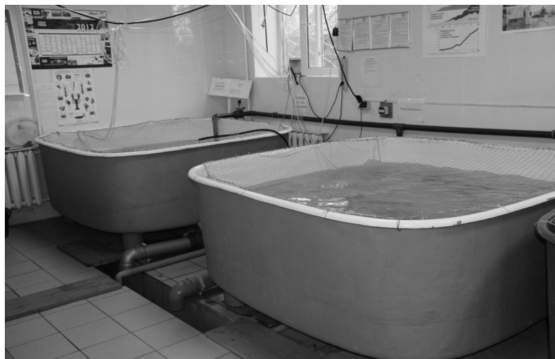
Рис. 1. Установка замкнутого водоснабжения

Плотность посадки составляла 2 шт./м 3 .