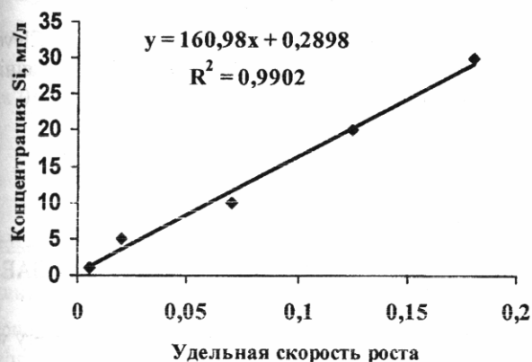
Рис. 3. Зависимость удельной скорости роста микроводоросли Skeletonema costatum от концентрации кремния в питательной среде F/2

Зависимость удельной скорости роста микроводоросли S. costatum от концентрации кремния в питательной среде описывается линейной функцией (рис. 3).