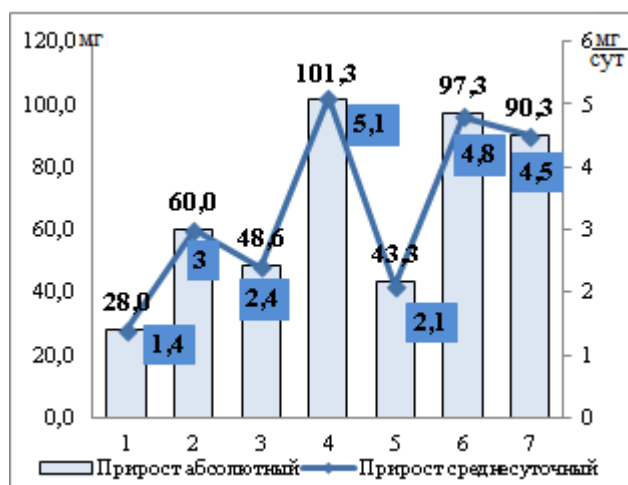
Рисунок 1 – Прирост особи молоди трепанга при кормлении кормами на основе натуральных и ферментированных морских растений

1 – натуральная сахарина; 2 – ферментированная сахарина; 3 – натуральная анфельция; 4 – ферментированная анфельция; 5 – натуральная зостера; 6 – ферментированная зостера; 7 – контроль.