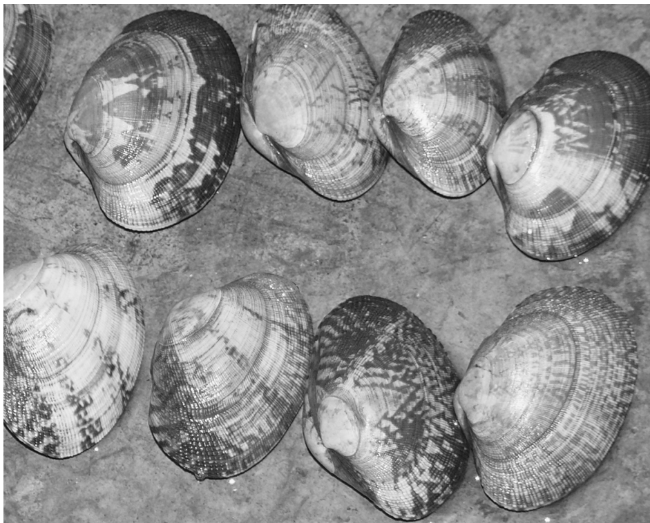
Рис. 1. Взрослые особи петушка тихоокеанского Ruditapes philippinarum

Моллюсков, начавших нереститься, перенесли в другие нерестовые емкости, заполненные морской водой с температурой, соответствующей температуре нереста, где они продолжали нереститься. После окончания нереста моллюсков удалили,