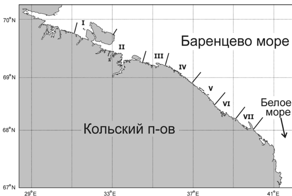
Рис. 1. Карта района работ и схема разбивки береговой линии Кольского полуострова на участки, по которым проводили расчет запаса гребешков в диапазоне глубин 0-40 м. Римскими цифрами обозначены участки побережья, жирными линиями – их границы (табл. 1).