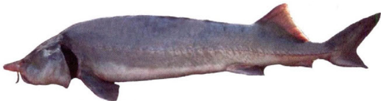
Рис. 1. Белуга Huso huso (Linnaeus, 1758)

более 120 лет [7]. В настоящее время предельный возраст белуги не превышает 52 года, длина – 400 см, масса – 380 кг.