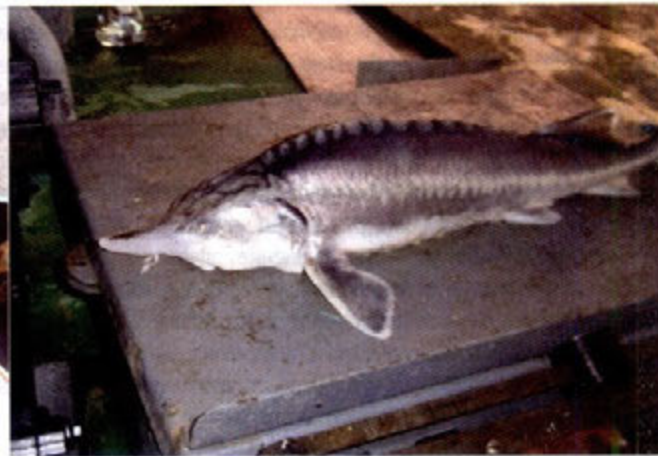
Рис. 3. Молодь белуги в исследовательских орудиях лова