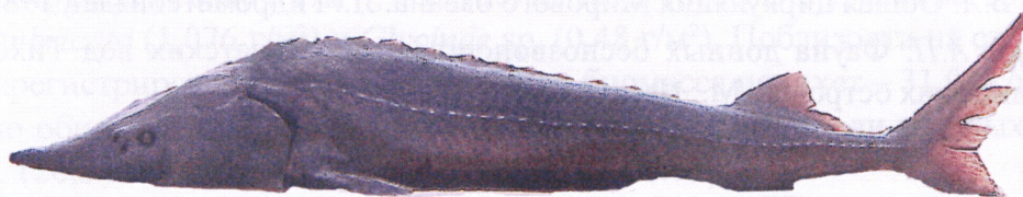
Рис. 1. Сибирский осетр, длиннорылая особь.

Все ранее опубликованные материалы относились к колымскому осетру из нижних участков Колымы (республика Саха – Якутия). На территории Магаданской области, где расположены верхнее и значительная часть среднего течения реки, до 2005 г., не было документированной поимки ни одного экземпляра данного вида, хотя устные сведения поступали от местного населения.