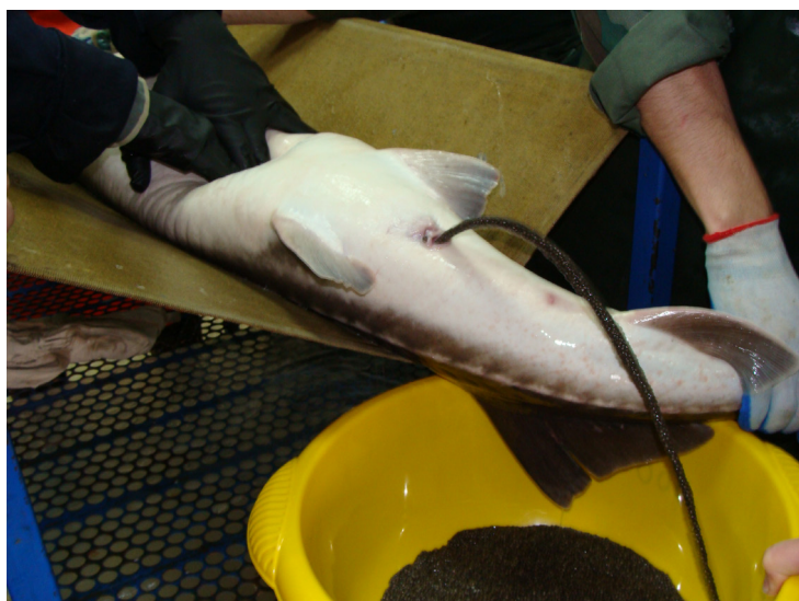
Рис. 3. Получение икры от самки амурского осетра