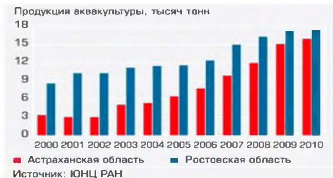
Рис. 2. Динамика роста объемов товарного рыбоводства в Ростовской и Астраханской областях

В России доля продукции аквакультуры в общем объеме добычи водных биоресурсов составляет примерно 3–4 %, в то время как мировое производство продукции рыбоводства доходит до 50 %. Сравнивая ситуацию по федеральным округам, отметим весьма показательный факт – четверть от общего объема добытых водных биоресурсов в ЮФО РФ (32 из 133 тыс. т) приходится на рыбоводную продукцию (рис. 2).