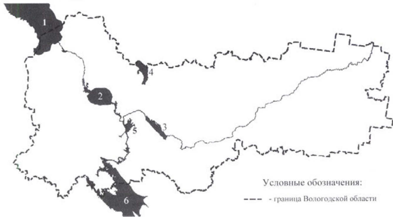
Рис. 1. Рыбохозяйственные водоемы Вологодской области: 1 – Онежское оз.; 2 – Белое оз.; 3 – Кубенское оз.; 4 – оз. Воже; 5 – Шекснинское водохранилище; 6 – Рыбинское водохранилище

В статье анализируется современное состояние запасов основных промысловых видов рыб важнейших рыбохозяйственных водоемов Вологодской обл. и их использование различными категориями пользователей. В работе раскрываются основные проблемы, связанные с эксплуатацией водных биоресурсов в системе промышленного и спортивно-любительского рыболовства региона.