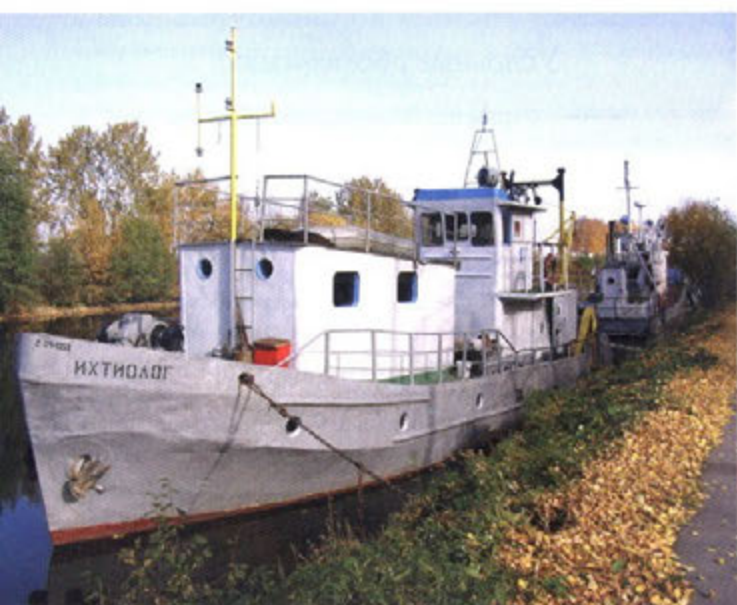
Рис. 2. Научно-исследовательское судно – теплоход «Ихтиолог»

В целом в 2012 г., в рассматриваемых водоемах Вологодской обл., по объемам общего вылова доминировал лещ, доля которого составляла около 33% от величины рыбодобычи (табл. 2). Высокую долю в уловах, как правило, пре-