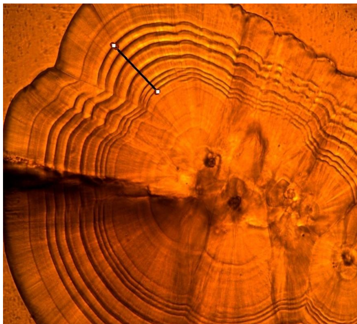
Рис. 1. Метка 3п,1,3Н (генерация 2009 г.) на отолите производителя кеты в возрасте 3+ (Сокольниковский ЛРЗ)

Таким образом, за период исследований с 2013 по 2015 гг. удалось идентифицировать рыб с меткой