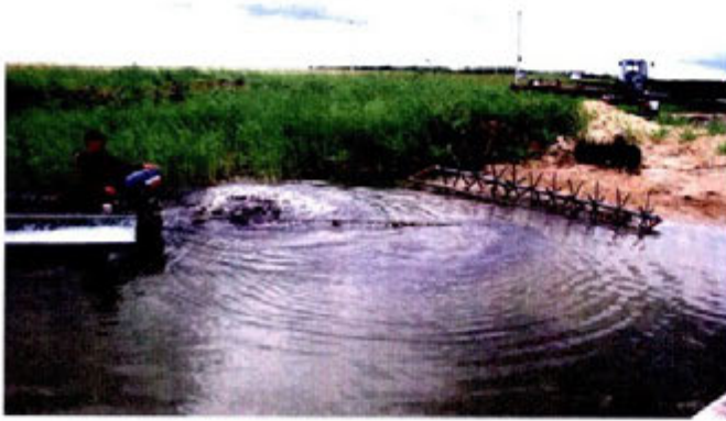
Фото 2. Погружение рыхлителя ила на озере Зубаревское Армизонского района Тюменской области

тивированию карпа в озерах, поскольку в озерах Мисяш, Кысыкуль, Шарташ и ряде других водоемов Южного Урала было отмечено его естественное воспроизводство, благодаря чему промысловые уловы карпа достигали 30-50 кг/га. В 50-60-е годы в озерах Челябинской, Свердловской и Курганской областей специалисты местных рыбпромов совместно с учеными УралВНИОРХ приступили к культивированию гибрида, акклиматизированных в местных водоемах, чудского сига и ладожского рипуса. Гибридные формы РхС, СхР – рипуса и сига, благодаря гетерозису, оказались быстрорастущими, заметно обгоняющими одновозрастные родительские виды. Осенью они имели массу: сеголетки 80-150 г, двухлетки – 250-500 г, трехлетки – 600-900 г, четырехлетки – 1100-1500 г [11], а выход товарной сиговой рыбы в монокультуре с 1 га озер карасевого ихтиологического типа стал достигать 50-60 кг/га в год. Таким образом, ученые Урала, на основе анализа кормовой базы водоемов, рационов потребления корма и темпа роста рыб, четко сформулировали, что средними, для лесостепной зоны, уловы рыбы, выращиваемой методом поликультуры из сиговых и карпа, должны быть в пределах 100 кг/га.