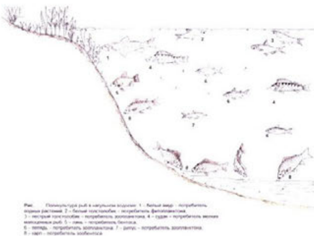
Рис. Поликультура рыб в озерных водоемах: 1 – белый амур – поликультура, озера раститель; 2 – белый амур, карась – поликультура, фитопланктон; 3 – лещ, карась, карп – поликультура, зоопланктон; 4 – судак – поликультура, мелкая зоопланктонная рыба; 5 – лещ – поликультура, фитопланктон; 6 – пелядь – поликультура, зоопланктон; 7 – карп – поликультура, зоопланктон; 8 – карп – поликультура, зоопланктон

В 1953 г. под руководством Г.А. Головкова из Ленинградского ВНИОРХ был успешно осуществлен сбор икры пеляди из улова на р. Сыня и пеляди из оз. Ендырь Тюменской области. Небольшая часть проинкубированной икры озерной пеляди на Волховском заводе, весной 1954 г. [14; 30] была доставлена на Урал и вселена в озера Карагайкуль (Челябинская обл.) и Белое (Свердловская