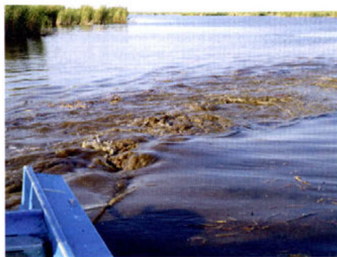
Фото 1. Рыхление (боронование) донных отложений на озере Таволжан Сладковского товарного рыбоводческого хозяйства