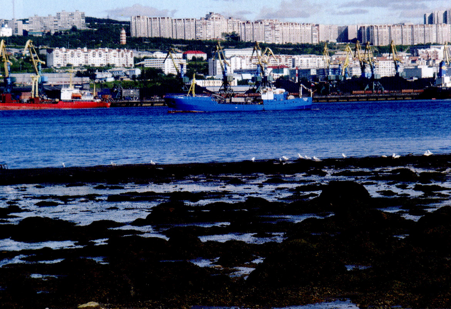
Рис. 1. Общий вид литорали кутовой части Кольского залива

экономически целесообразной и наиболее результативной формой деятельности может быть пастбищное выращивание трески, докармливание и, возможно, искусственное воспроизводство камчатского краба, культивирование морского ежа, в перспективе – арктического гольца.