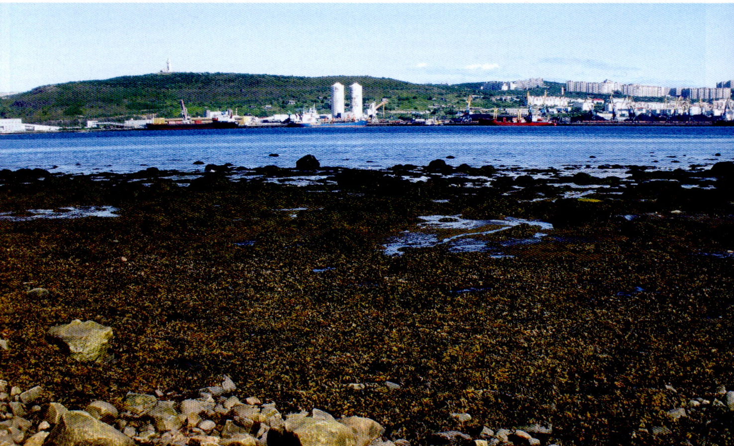
Рис. 2. Фукусовые водоросли Кольского залива. Отлив.

Голец озерный (Salvelinus alpinus lepechini G.) . Ценный в пищевом отношении объект, который в настоящее время добывается в озерах Мурманской обл. только в качестве прилова. Природные формы тугорослые, но в условиях рыбоводных заводов растет хорошо и перспективен как объект пастбищного выращивания и заводского воспроизводства в озерно-речных системах Кольского полуострова.