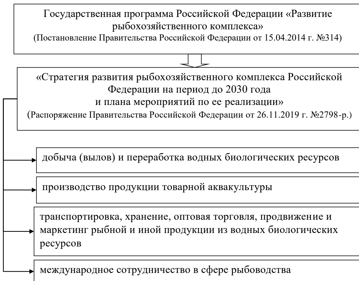
Рисунок 1 - Нормативно-правовое регулирование стратегического развития рыбохозяйственного комплекса Российской Федерации [2], [3]