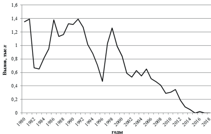
Рис. 1. Динамика вылова муксуна в водных объектах Тюменской области.

делах Омской области, этот вид не отмечает. В проведенных контрольных уловах отсутствовали не только половозрелые особи, но и молодь. Следует отметить, что в пределах Омской области пойменная система у р. Иртыш слабо развита, что может отрицательно сказываться на выживаемости личинок муксуна. Как установлено, степень и продолжительность залития сором в Средней Оби оказывает существенное влияние на урожайность поколений муксуна (Matkovskiy, 2014; Матковский, 2018).