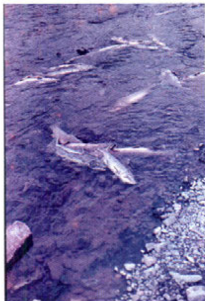
Рис. 2. Погибшие после нереста производители на полуострове Камчатка.

С целью выяснения причин слабого роста уловов горбуши нечетной линии и затухания линии четных годов, мы обобщили имеющиеся публикации и собственные наблюдения за динамикой численности животных, воспроизводство которых зависит от абиотических факторов. Изучение биологии акклиматизируемой горбуши позволило исследователям сделать вывод, что многочисленная нерестовая популяция горбуши способна сформироваться лишь в годы с благоприятными гидрометеорологическими условиями. При раннем нересте в годы с теплой осенью инкубация икры происходит удовлетворительно. При позднем созревании и холодной осени икра не успевает набрать необходимые ей для полноценного созревания 200-250 градусодней и погибает. Поэтому величина возврата горбуши выше в годы потепления Севера и формирования, в связи с этим, более благоприятных температурных условий в районах нагула и нереста [12].