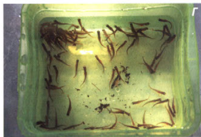
Рис. 3. Испытание гнезд-инкубаторов с выносным (а, б) и прижимным (в) водозаборниками на реках Лижма и Суна. Личинки лосося из гнезд р. Лижма (г)

частицы ила или детрита, поэтому их необходимо периодически обслуживать, заменяя фильтры и удаляя погибших личинок [9]. В условиях сурового климата Северо-Запада России обслуживаемые устройства непригодны, т.к. невозможно их поднимать в период ледостава. В связи с этим, а также по причине снижения трудозатрат, предпочтительнее использование необслуживаемых устройств, запитанных на естественно очищенном подрусловом потоке [5; 2; 3].