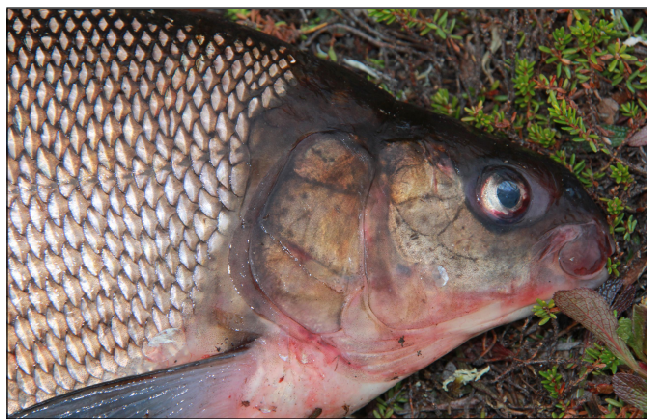
Рис. 1. Чир из озера Хоседаты.