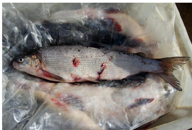
Рис. 3. Чир из р. Кожимью.

Все эти случайные, практически единичные находки вида в обширнейшем бассейне р. Печоры за более чем 20-летний период позволяют судить о величине ареала вида. Оказалось, что распространение чира в печорской речной системе не ограничивается низовьями водотока и его тундровыми притоками. Подходящие местообитания имеются и в столь удаленных от магистрального русла Печоры ее притоках разного порядка, относящихся к бассейнам среднего и верхнего течения, таких как Белая Кедва (Средний Тиман), Лемва (Полярный Урал), Вангыр (Приполярный Урал) и Илыч (Северный Урал). Связано это с последствиями изменений климата или так истори-