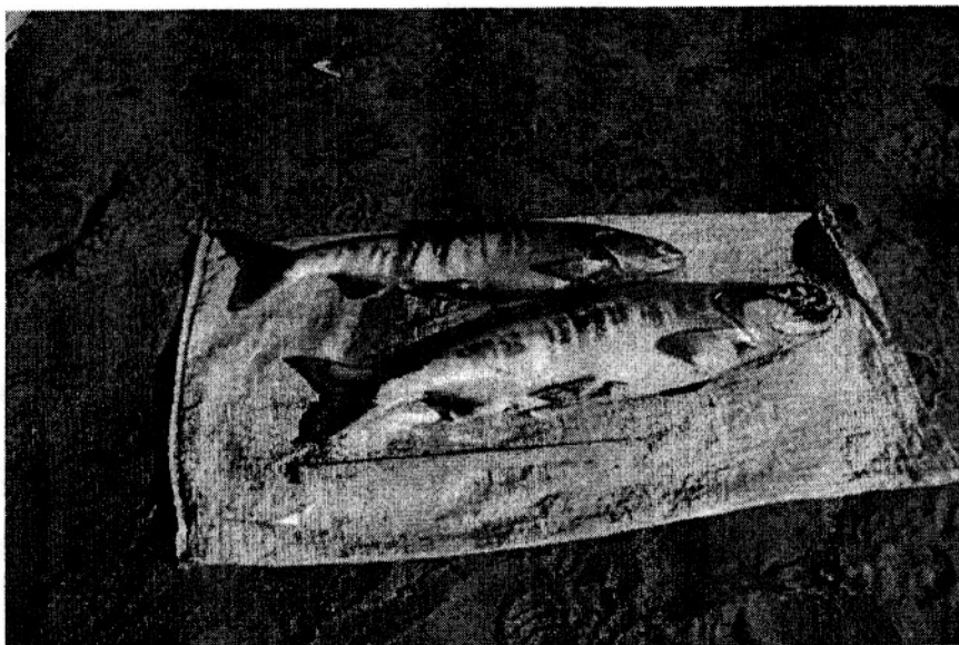
Рис. 2. Самка кеты. Длина АС – 61 см. Самец кеты. Длина АС – 69,5 см (р. Колыма, Сугойский кривун (1 330 км), 2005 г.).

Fig. 2. Oncorhynchus keta from Kolyma river. Female. Length АС – 61 cm. Male. Length АС – 69,5 cm (Sougoy bend (1 330 km), 2005).