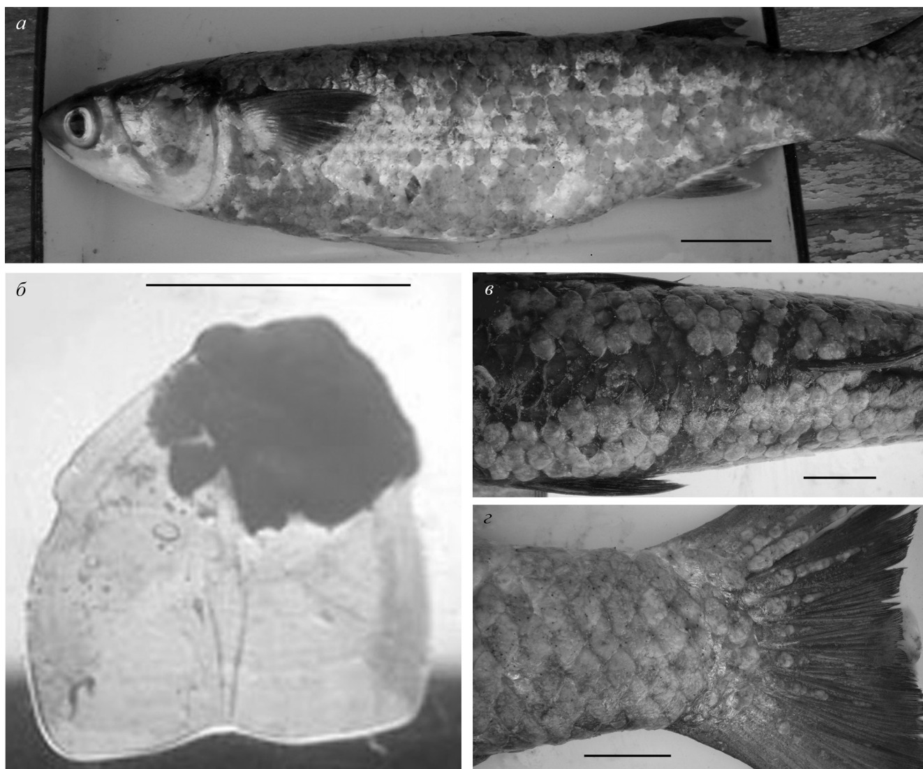
Рис. 1. Mugil cephalus с поражениями, вызванными Myxobolus episquamalis : а – общий вид рыбы; б – многоядерный плазмодий на поверхности чешуи; в, з – пораженная плазмодиями чешуя на спине и хвостовом стебле рыбы. Масштабные линейки – 5 см. Fig. 1. Mugil cephalus with dermatitis caused by Myxobolus episquamalis : а – general view of the fish; б – multinuclear plasmodium on the scale; в, з – dorsal and caudal areas of the affected fish. Scale bars 5 cm.

ны с помощью компрессионного метода под микроскопом для обнаружения спор миксоспоридий. Собранный материал изучали как на водных, так и на глицерин-желатиновых препаратах по методикам З.С. Донец и С.С. Шульмана [26] и Ж. Лома и Дж.Р. Артура [43]. Споры исследовали под световым микроскопом Leica DMLB с фотокамерами Leica ICC50 и Leica LAS EZ software. Измерения были проведены на 30 экземплярах спор (среднее ± стандартная ошибка, размах). Экстрагирование ДНК проводили с помощью оборудования для генетической очистки ДНК (DNeasy Tissue Kit (Qiagen)) согласно существующему протоколу. Универсальные праймеры А (5'-ACCTGGTTGATCCTGCCAGT-3')