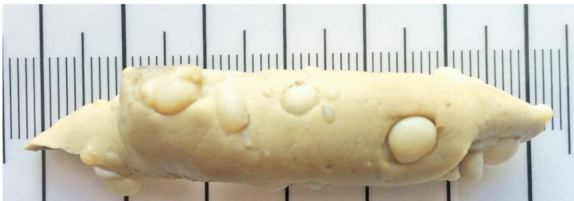
Рис. 2. Цисты на печени рыбы (сиг № 1)