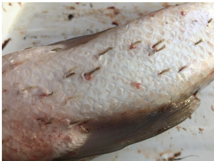
Рис. 3. Инвазия белого амура лернеями в одном из прудовых хозяйств Краснодарского края

показатели зараженности при этом были низкими. ИИ не превышала 1 экз., а ИО варьировал в пределах 0,03–0,2 экз.