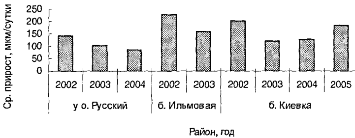
Рис. 2. Скорость роста спата M. yessoensis на коллекторах. \bar{y}

Соленость во всех исследованных районах в основном варьирует в пределах нормы (32-33 ‰), она может кратковременно понижаться только в результате выпадения обильных осадков.