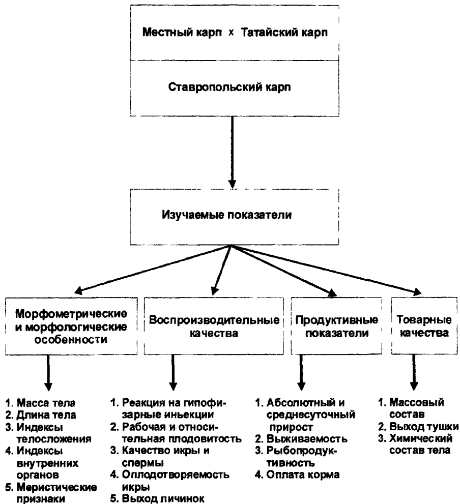
Рис. 2. Схема исследований

При воспроизводстве рыбы применяли заводской метод. Учет количества икры, полученной от каждой самки, проводили весовым способом, подсчет личинок - объемным методом. Качество икры оценивали по её размерно-весовым показателям и проценту оплодотворения. Качество спермы (концентрация и подвижность спермиев) - по общепринятой методике (Казаков, 1978).